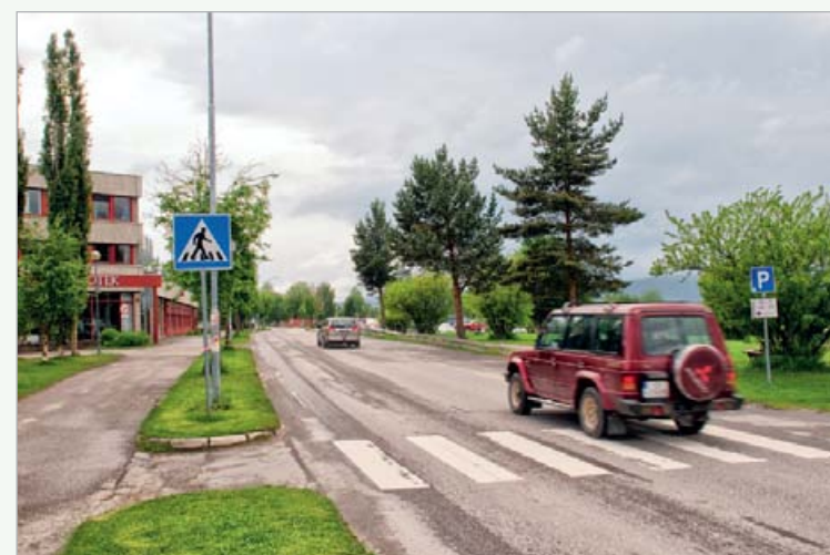
Når anleggsarbeidet med oppjusteringen av jernbanetorget er i gang blir Kongsveien i perioder stengt for gjennomkjøring