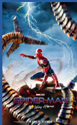
Spider-Man: No Way Home Action/eventyr/superhelt Premiere 17. desember