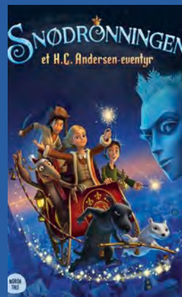
Snødronningen Animasjon/barn-/fam.film Premiere 25. desember