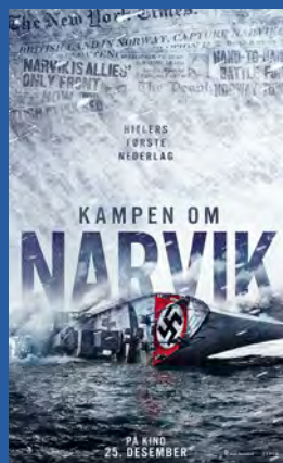
Kampen om Narvik Krigsfilm Premiere 25. desember