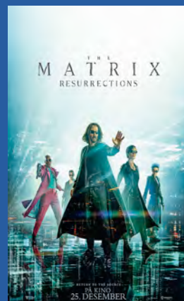
The Matrix Resurrections Action / sci-fi Premiere 25. desember