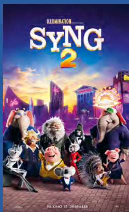
Syng 2 Animasjon/barnefilm Premiere 25. desember