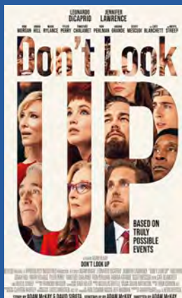
Don't Look Up Drama/komedie Premiere 10. desember