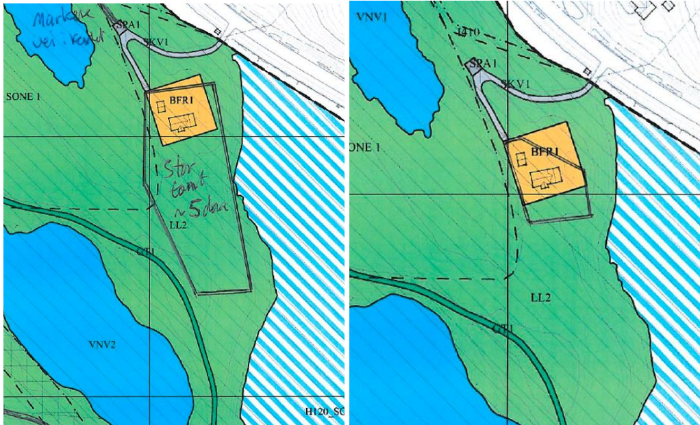
Alternativ A er illustrert til venstre, og alternativ B til høyre.

Tursti – skiløype, GTI: Ønsker at bestemmelsen 3.1 Tursti- skiløype tillegges følgende setning «Unntak fra forbudet for motorisert ferdsel gjelder også grunneiers tilgang til eiendommen med traktor og løypemaskin». Gjelden viser til opprinnelig avtale med skiarenaen da det ble gitt tillatelse til å bygge asfalterte løypetraseer og turstier på hans eiendom, at Gjelden kunne benytte traseene som atkomst med traktor til sin eiendom.