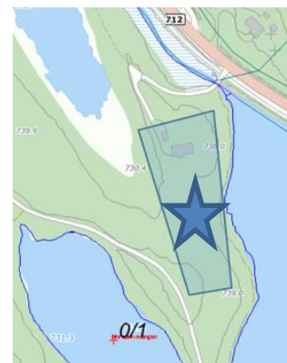
Ønsket utskilt hyttetomt

Planen åpner for at ønsket tiltak kan gjennomføres etter søknad og godkjenning etter Motorferdsellovens § 6.