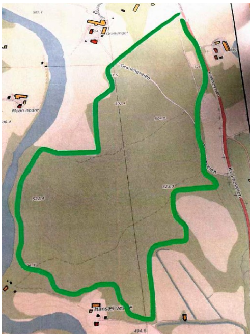
Figur 1: Skissert planomriss fra kommunestyret

Kommunestyret peker på et meget sentralt område i Tunndalen med nærhet til Rv 3. Området består av hovedsakelig furuskog av middels bonitet og det vil være lite dyrka mark som blir berørt.