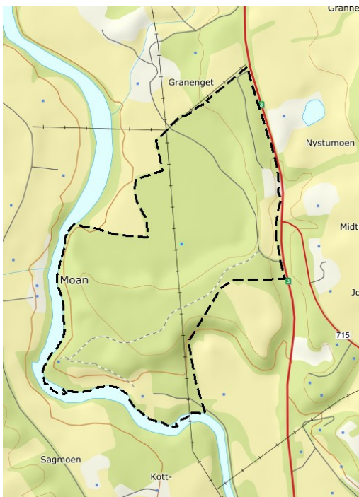
Figur 2: Utvidet plangrense

Planområdet utvides litt i forhold til skissen fra kommunestyret, Dette er gjort for å få med areal som ligger i randsonen ned mot Tunna og mot Rv3 og for å få en mer naturlig avgrensing.