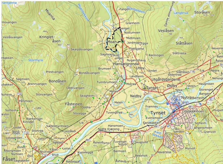
Figur 3: Planområdets plassering

Området som vil reguleres til næring ligger på to forholdsvis flate platåer, dette kan brukes som et naturlig skille i området, men det er også mulig å gjøre inngrep for å få alt av næring på et nivå. Det er skråning ned mot Rv3, landbrukseiendommen på Styggmyra og hytteeiendommen ned mot Tunna som gir et naturlig skille. Det er noe dyrka mark som grenser til planområdet, både i nord og i øst, som ligger på platå med tenkt næringsområde. Det skal legges opp til å ha skjerming mellom næringsområde og annen bebyggelse/bruk.