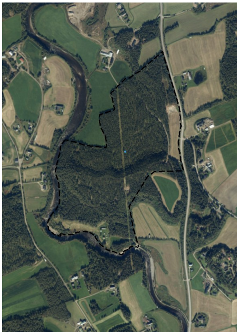
Figur 4: Plangrense, flyfoto

Det å få til en god avkjørsel fra Rv3 vil være en utfordring med å bruke dette området. Det som finnes av avkjørsel til området i dag vil ikke være tilfredsstillende, både med tanke på utforming og siktforhold, når det blir økt trafikk inn og ut av området. Ny avkjørsel til Rv3 kan føre til at det må bygges ned noe dyrka mark.