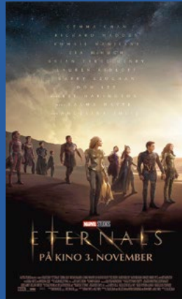
Eternals Action / superhelt / sci-fi Premiere 3. november