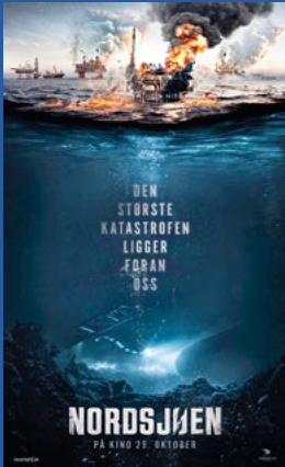
Nordsjøen Drama Premiere 29. oktober