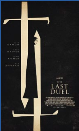
The Last Duel Drama Premiere 15. oktober