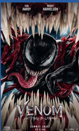
Venom: Let there Be Carnage Action Premiere 12. november