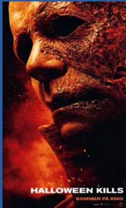
Halloween kills Horror Premiere 15. oktober