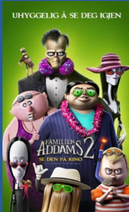
Familien Addams 2 Animasjon / barnefilm Premiere 29. oktober