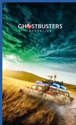
Ghostbusters: Afterlife Action / komedie Premiere 26. november