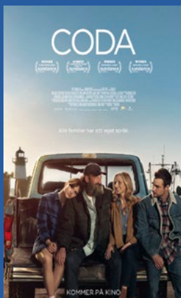
Coda Drama Premiere 19. november