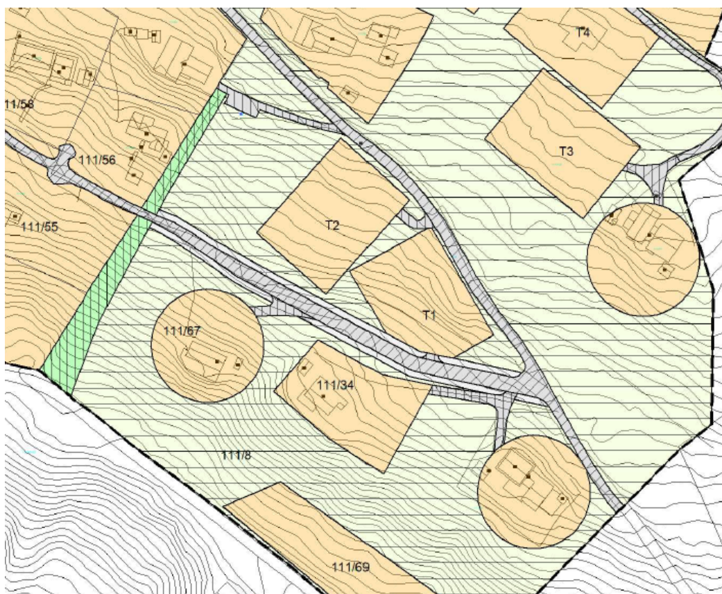
Utsnitt nytt planforslag

Endringene foreslått i planen vurderes til å oppfylle disse kravene. Det er kun kartet som endres.