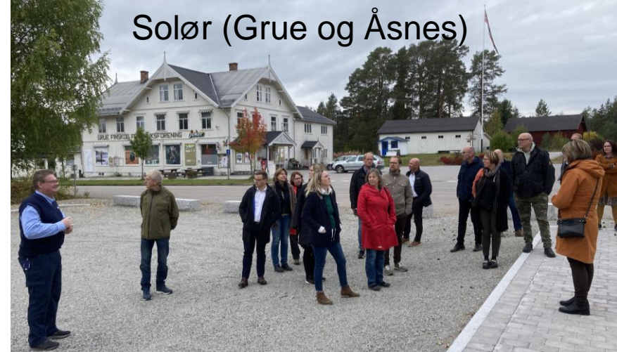
Solør (Grue og Åsnes)