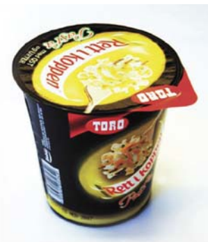
Lett å forstå, lett å åpne

Hensynet til universell utforming er i ferd med å bli bedre forankret og nedfelt i plan- og bygningslovgivningen. I dagens plan- og bygningslov er universell utforming ennå et relativt lite synlig tema, men den tekniske forskriften som følger loven (TEK) har bestemmelser og krav til universell utforming som man må rette seg etter når man eksempelvis planlegger et nytt bygg. Hensynet til universell utforming er styrket i en ny plan- og bygningslov som vil tre i kraft fra 1.juli 2009. Det er også utarbeidet et utkast til rikspolitiske retningslinjer for universell utforming, som ennå ikke er vedtatt.