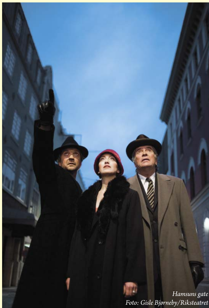
Hamsuns gate

Musikalen settes opp i samarbeid med Hedmark Teater, Runar Borge (Chateau Neuf) og Midt Østerdal Musikalen. Hedmark Teater ved Rolf Norsen står for regien og Runar Borge er konsulent og regissør av dansenummeret. Arrangert av MidtøsterdalMusikalen