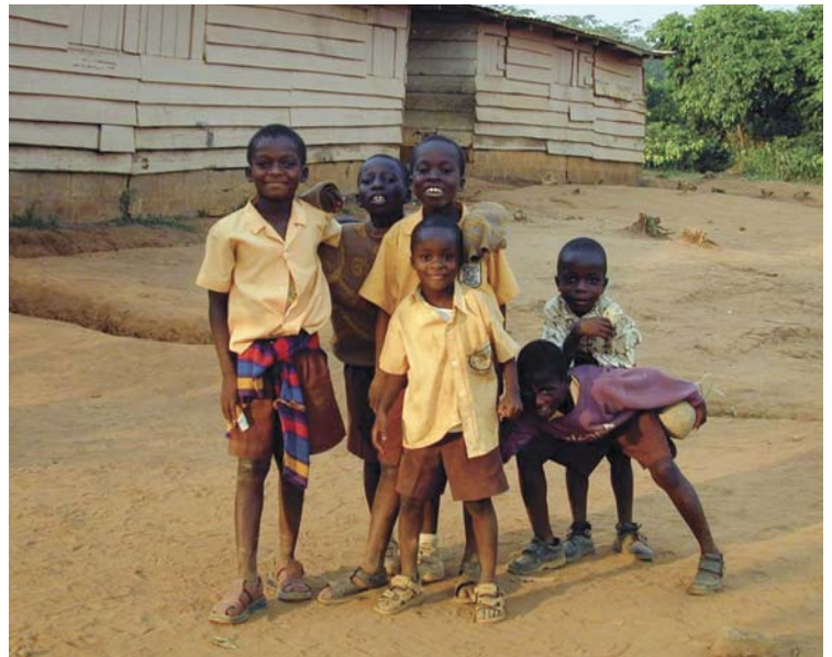
Tynset kommune vil gi barn med flykningestatus en ny framtid

Kommunestyret vedtok i januar å imøtegå IMDIs anmodning om å bosette 15 personer pr år i perioden 2009-2011. I tillegg kommer familie-gjenforening.