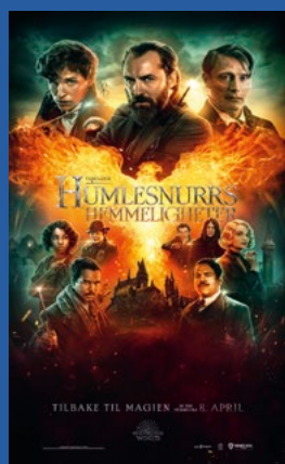
Fabeldyr: Humlesnurrs hemmeligheter Fantasi / eventyr Premiere 8. april