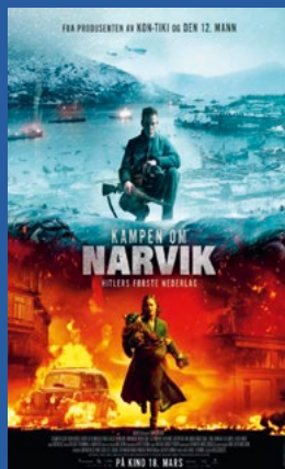
Kampen om Narvik Krigsfilm (Premiere 18. mars)