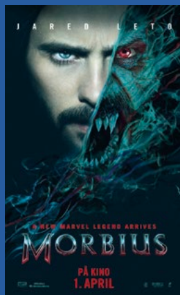
Morbius Action / sci-Fi / horror Premiere 1. april