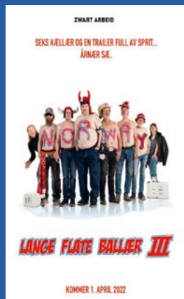
Lange flate ballær III Komedie Premiere 1. april