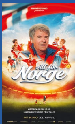
Alt for Norge Dokumentar Premiere 22. april

Se fullstendig program med forestillinger og priser på www.tynsetkino.no Billettsalget starter 1 time før forestilling Telefon billettsalg: 62 48 52 03