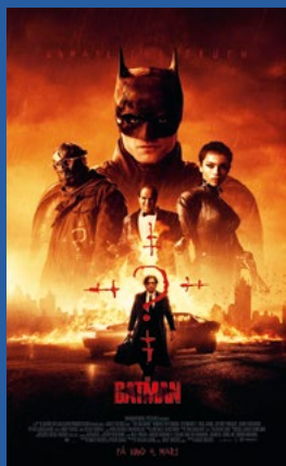
The Batman Action / krim / drama (Premiere 3. mars)