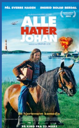
Alle hater Johan Komedie Premiere 25. mars