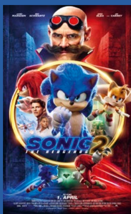
Sonic The Hedgehog 2 Action / eventyr / animasjon Premiere 1. april