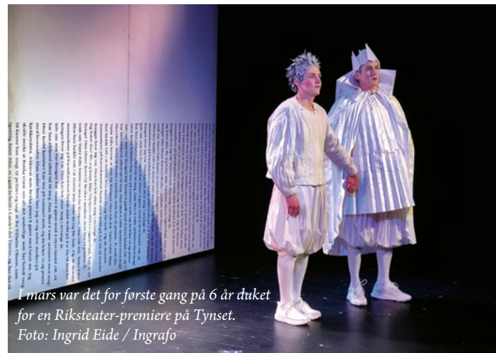
I mars var det for første gang på 6 år duket for en Riksteater-premiere på Tynset.

I mars i år hadde Riksteateret teaterpremiere på Tynset for første gang siden 2016, nå med "Mio, min Mio".