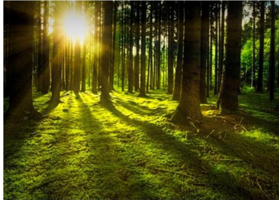
Treer i skogen

Les mer informasjon om webinaret på statsforvalterens nettsider