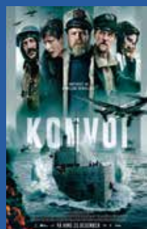
Konvoi Action / drama (ikke aldersklassifisert)