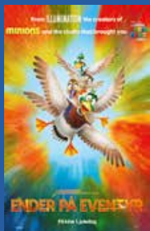
Ender på eventyr Barnefilm / animasjon (6 år)