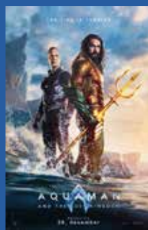
Aquaman and the Lost Kingdom Komedie / superhelt-film / action (12 år)