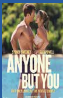
Anyone But You Romantikk / Komedie (ikke aldersklassifisert)