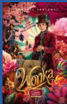
Wonka Familiefilm (6 år)