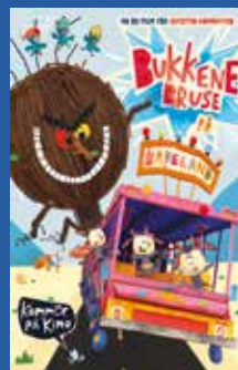
Bukkene Bruse på badeland Barnefilm / animasjon / komedie (tillatt for alle)