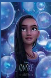
Ønske Eventyr / animasjon / familiefilm (6 år)