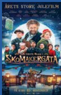
Den første julen i Skomakergata Familiefilm (6 år)