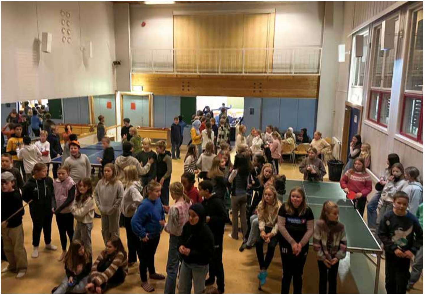
Det kom nærmere 80 ungdommer på åpningskvelden 26. oktober. Ingen tvil om at kvelden ble en suksess