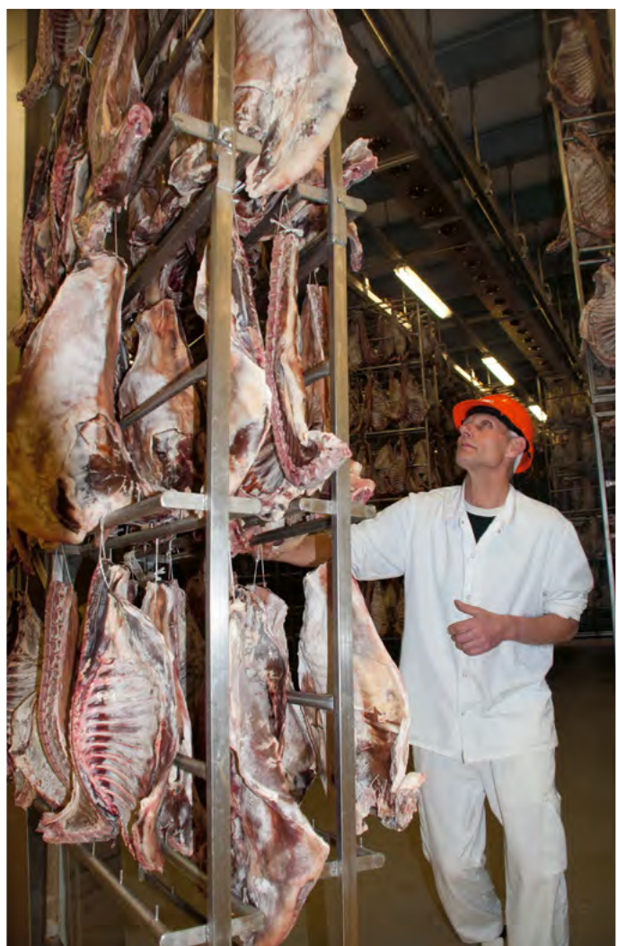
Fra Norturas anlegg på Tynset.