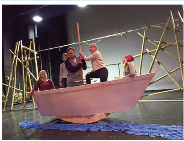
Fyrverkerimakerens datter legger ut på en lang og farefull reise. Her fra prøvene i Tynset kulturhus.