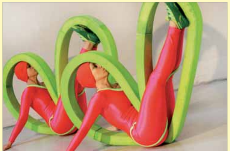
Fra forestillingen Ooujeeih.

Danseforestilling med Riksteatret. BARNEDANS.