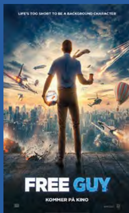
Free Guy Action / komedie