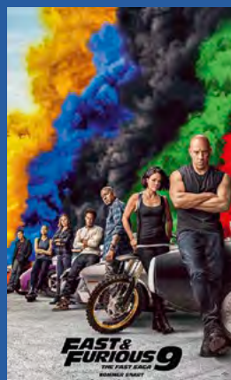
Fast & Furious 9 Action