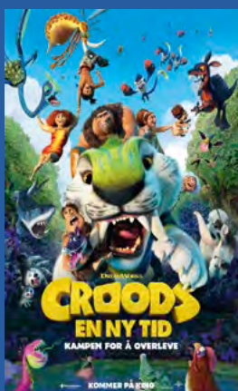
Croods - En ny tid Animasjon