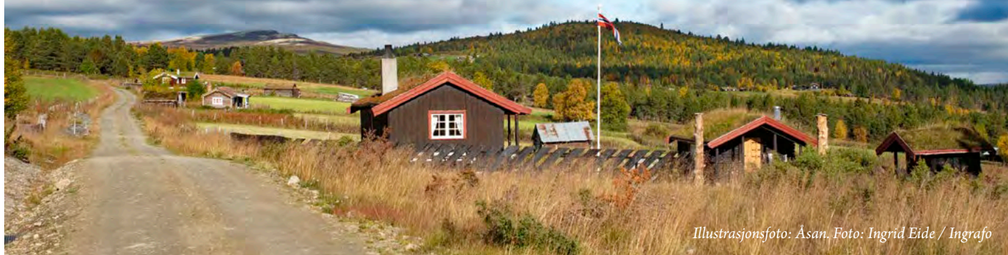
Illustrasjonsfoto: Åsan. Foto: Ingrid Eide / Ingrafo