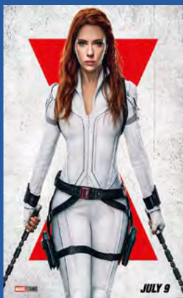
Black Widow Sci-Fi / action / fantasy