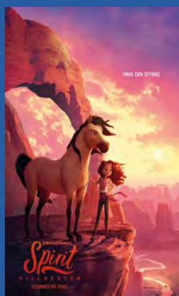
Spirit Villhesten Animasjon / familiefilm