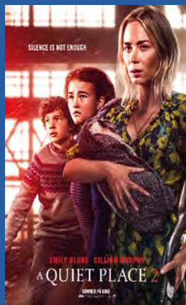
A Quiet Place 2 Thriller / horror