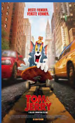
Tom & Jerry Animasjon / komedie